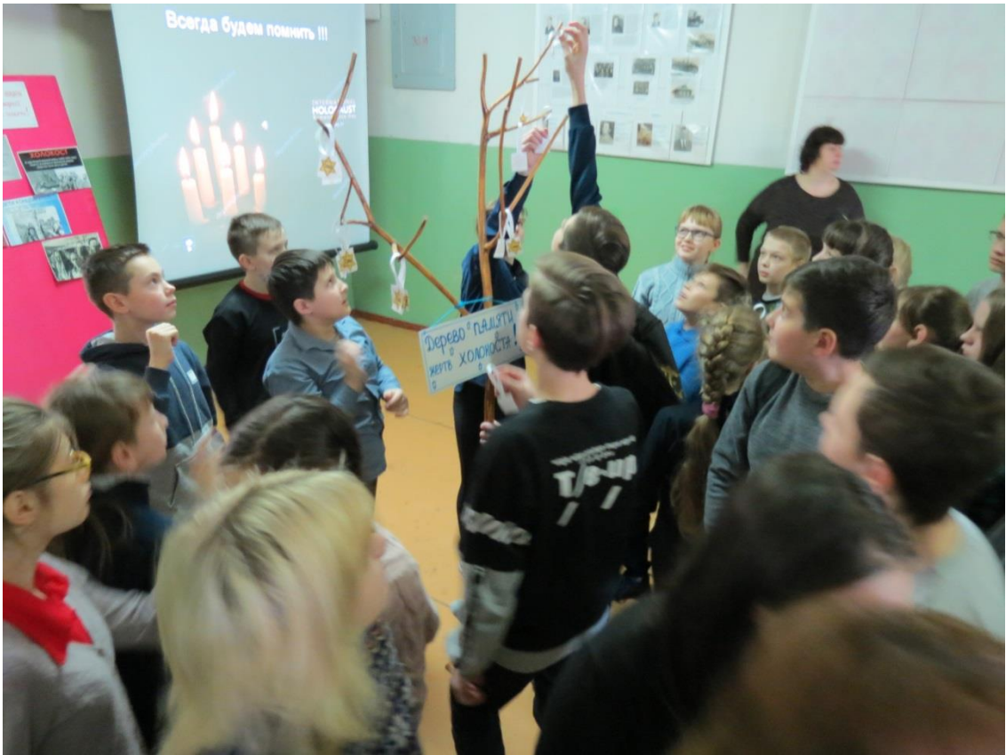
Закончилось мероприятие символической акцией «Дерево памяти жертв Холокоста».